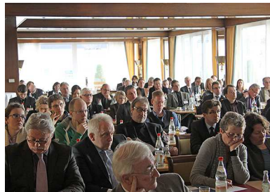
5260 - Die Veranstaltung war mit mehr als 80 Teilnehmern gut besucht